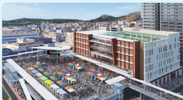
呉駅前再開発 駅周辺地域を総合交通拠点とし、交通まちづくりとスマートシティの発信拠点を形成