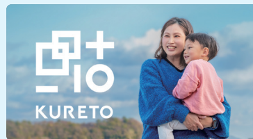
移住定住販促 呉市移住定住ポータルサイト『KURETO』移住を検討している方に呉市の魅力を発信中