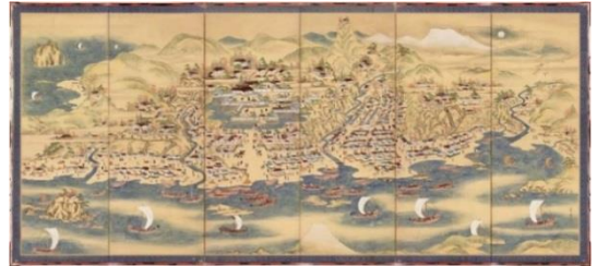
当時の町の賑わい（松前町）

もう一つは、山と海の間のおずかな平坦地に位置する「山に抱かれる」港です。一度の航海で巨万の富が得られる北前船が頻繁に行き交うようになると、風待ち港も含め多くの寄港地が整備されました。砂丘の多い日本海沿岸では、山と海に挟まれたわずかな平坦地を利用し、コンパクトな港や集落を築いています。古い建物や荷揚場、船止めの杭など、北前船によりもたらされた、文化遺産が集約された町並を歩いて回ることができます。