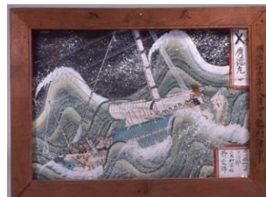
危険な航海の様子（加賀市）

熟練の操船技術を持つ船乗りにとっても、嵐にあえば「板子一枚下は地獄」の恐怖にさらされます。商品を無事に運べば多額の利益を得られる北前船も沈んでしまえば一巻の終わり、全財産を失う船主もいました。危険と隣り合わせの航海は、安全を神仏の庇護に求め、寄港地の中心や小高い丘には神社や寺院があり、港と並行に寺院が建ち並ぶ町もあります。ここでは、航海の無事を祈願した船絵馬や船模型、中にはちよんまげを奉納した「髻額」が奉納されています。また、境内には遠く離れた国名や問屋名