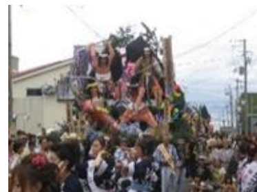
今でも賑わう港の祭り（秋田市）

北前船は生活必需品に加え、雛人形などの高級品、そして様々な文化を運んでいます。天候に左右される北前船の航海は、「風待ち」という文化により、出港までの間、料亭や茶屋などでの一時の出会いと別れと共に、そこで唄われる民謡など各地の芸能が船乗りたちによって伝わっていききました。代表的なのが、「おけさ」や「あいや節」などと呼ばれる哀調を帯びた節回しを持つ民謡です。この民謡は熊本で生まれた「ハイヤ節」が船乗りの間で歌い継がれ、北前船により日本海沿岸の港町に広まり、各地に根付いた芸能として親しまれています。