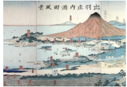
山を仰ぐ港（酒田市）

一つは、山を借景として大きな川の河口に位置する「山を仰ぐ」港です。日本海から仰ぐ名山は、古くから航海の目印となり、その近くに港を築いています。これらの港は江戸時代には、上方への年貢米の積出港となり、領内の穀倉地帯を流れる大河の河口に米倉、番所などが整備されました。名山を仰ぎ大河に抱かれる港が、日本海を經由し