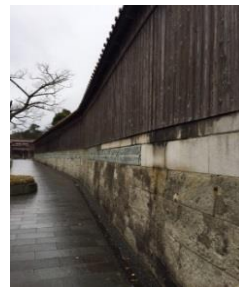
船主達が築いた町（加賀市）

解放を与えた花街や、日和を見た小高い山、航海の安全を祈った神社仏閣など、北前船がもたらした機能が整えられています。そこには、封建下にあつて近隣の稲作を中心とした農村や、その基盤上にある城下には見られない、海上輸送という手段を手にした商人たちの築いた町があります。想像もできないほど高い塀や、敷地内に多くの土蔵を持つ豪壮な屋敷を見て、「こんな所になぜ、こんな大きなお屋敷が」と言った、驚きや発見に出会うことができます。