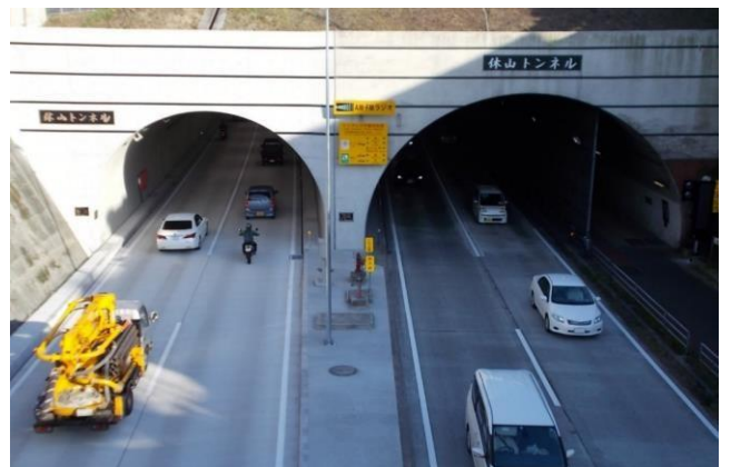
4車線化完成後の状況