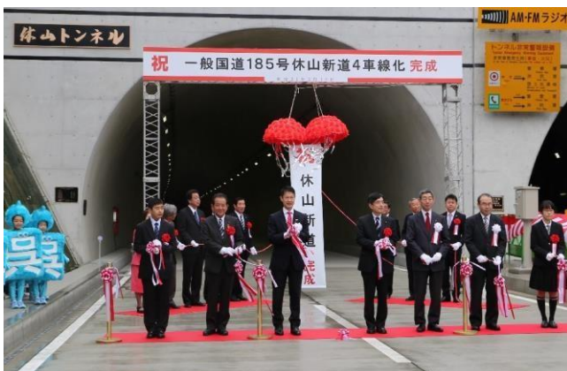
4車線化完成 平成31年3月10日