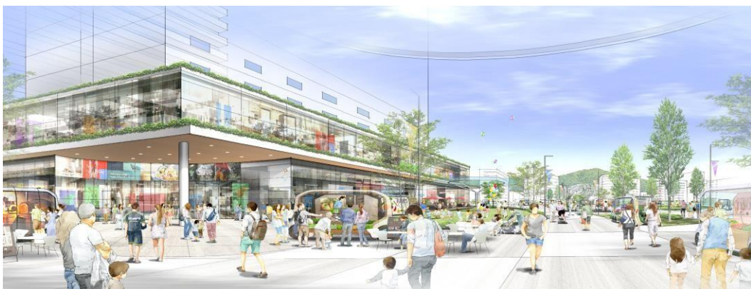
将来の呉駅周辺のイメージパース（駅ビルから出て2階デッキの上から灰ヶ峰見た景色）