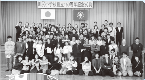
川尻小学校創立150周年記念式典