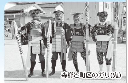
森郷と町区のガリ(鬼)