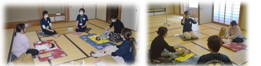
赤ちゃんすくすく健康講座

仁方まちづくりセンター主催の「プチママサークル」を10月12日(木)「赤ちゃんすくすく健康講座」、19日(木)「歌って遊ぼう」、26日(木)「親子で楽しくストレッチ体操」の日程で開催しました。 子育てに関する講義や実習を通して、不安や悩みを質問したり、参加されたお母さん同士のコミュニケーションを図ったりしました。