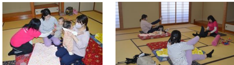
親子で楽しくストレッチ体操