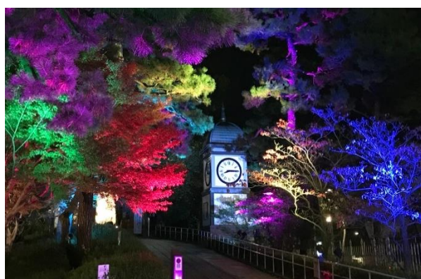
ライトアップした時計塔 (2022年実施の様子)