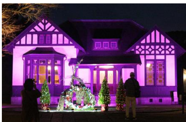
ライトアップされた長官官舎とクリスマスツリー (2021年実施時の様子)

入船山記念館では次のとおり、期間限定で施設のライトアップやイベントを開催します。