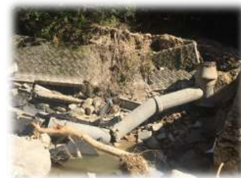
天応焼山汚水幹線（下水道）