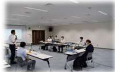
呉市上下水道等事業の経営に関する懇談会