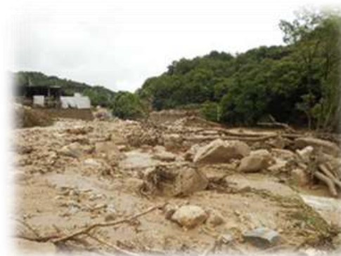
柳迫第1ポンプ所（水道）