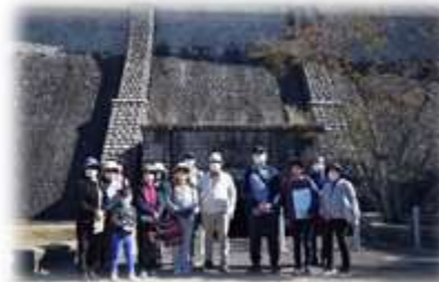
上下水道施設見学会

上下水道施設見学会など直接コミュニケーションをとることができる市民参加型イベントや、水循環の重要性を発信するための上下水道パネル展を継続して開催します。