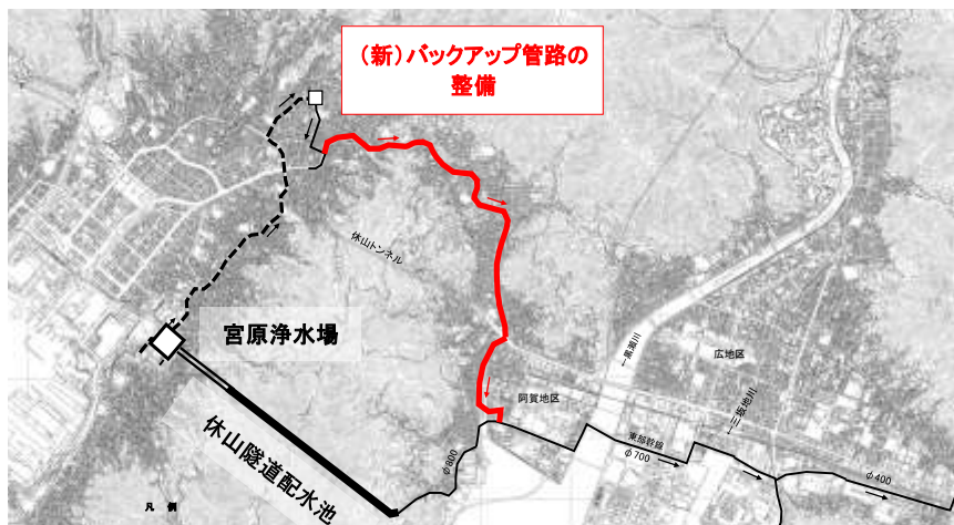
〔基幹配水池バックアップ管路図〕