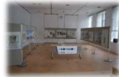
上下水道パネル展