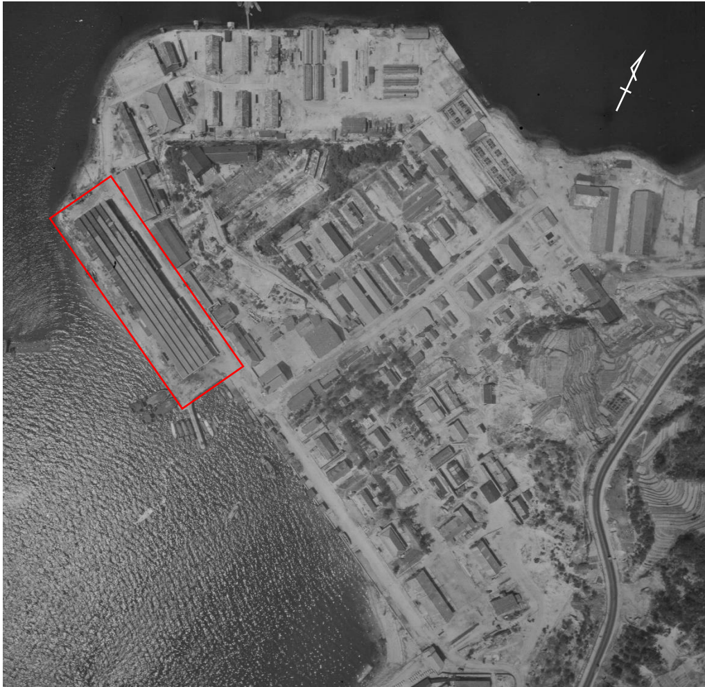
米軍の航空写真 (USA-M282-120) 昭和22年3月31日撮影