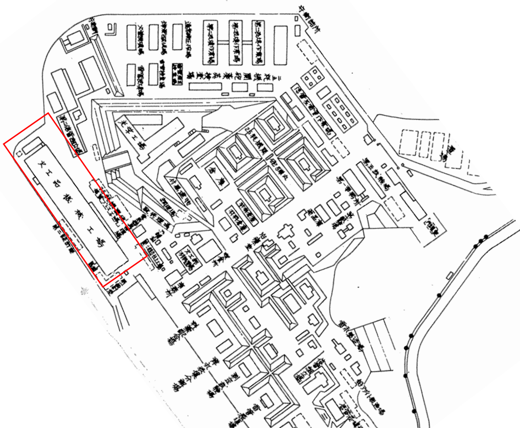
「呉市史第6巻付図 呉海軍工廠一般図」より一部抜粋