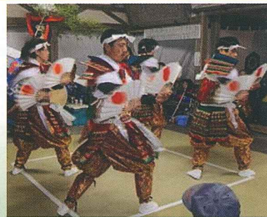
四天<提婆・扇の舞>