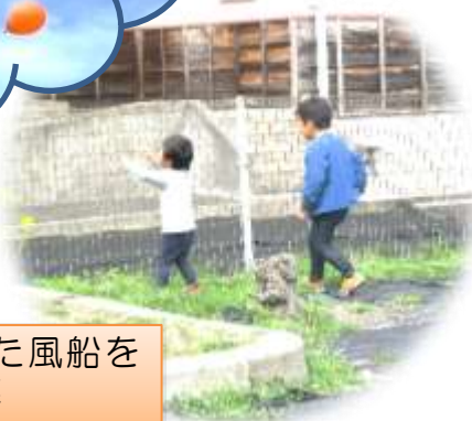
空高く飛んでいった風船を追いかける子ども達