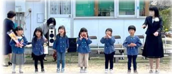
「忘れないよーありがとう」と感謝の気持ちをみんなで伝えました。