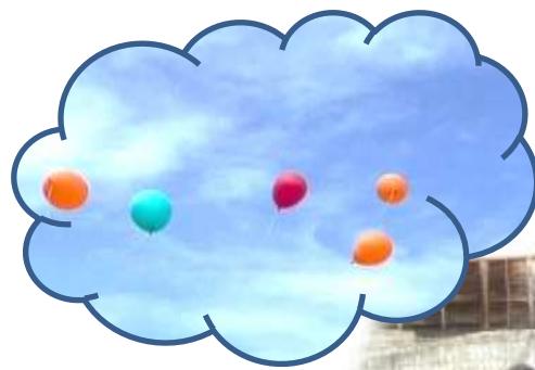
会の最中、かわいいハプニングが続々とありました。