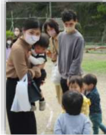
転んで泣いている子に「大丈夫？」となくさめにくる子ども達