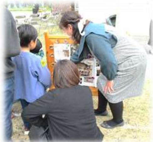
先生方が思い出の写真をたくさん展示してくれました。