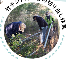
竹テント用の竹の切り出し作業

まち協竹テントチーム製作。やすうら青空市の竹でできた名物テント! 二神テントとも呼ばれている。(笑)