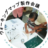
ウォーキングマップ製作会議

まち協竹テントチーム製作。やすうら青空市の竹でできた名物テント! 二神テントとも呼ばれている。(笑)