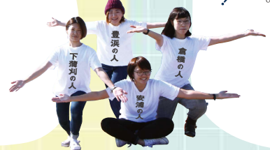
豊浜の人 下蒲刈の人 島橋の人