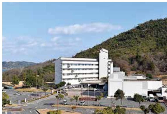
グリーンピアせとうちを支援

A 修学旅行者などの減少による利用料金の減収は、県民の浜輝きの館でもありますが、同施設は、県から事務管理委託を受けている施設のため、県が3月の補正予算で市を經由して支援を行い、黒字になっています。