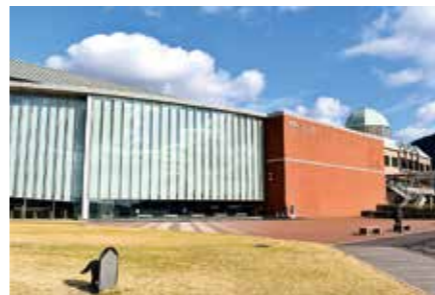
リニューアル予定の大和ミュージアム

現在進めている大和ミュージアムのリニューアルの方向性やスケジュールについて、最新の検討状況を伺います。