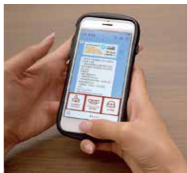
呉市からの情報をLINEで!

情報メニューの設定は、その時々々の社会情勢を踏まえながら、市民ニーズに的確に対応することにより、さらに分かりやすい情報発信ができるよう、努めていきます。また、「道路・公園損傷報告」をはじめ、LINEなどデジタル技術を活用して、市民の皆さまと様々な情報の授受をこれまで以上にいく必要があると考えており、そのための調査研究を前向きに進めていきます。