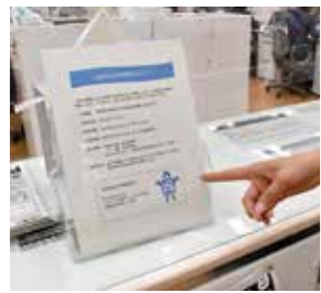
指差しで意思表示

本庁2階など3カ所では、言葉にせずともチラシに指をさしてもらうことで、生理用品を配布する工夫をしています。