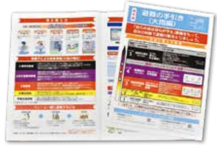
保存版 避難の手引きを傍に!

避難所開設が長期に渡る場合、住民と協働で運営することで、避難生活のニーズを容易に引き出せるため、好ましいと考えています。そのため、住民向けの運営マニュアルを作成し、啓発に努めています。また、避難所の円滑運営のためには、備蓄資材などの把握とその活用方法を知っていただくことが重要であり、出前トークなどで住民に周知し、災害発生時に地域住民と一丸となつて対応できるように努めていきます。