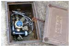
水道スマートメーター

問 スマートメーターの導入を 先端技術の活用で、業務の効率化や故障予知診断などが可能になり、さらには、高齢者の見守りなどにも利用できるため、水道メーターをスマートメーター化すべきではないですか。