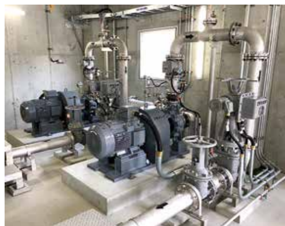
復旧した川尻柳迫第1ポンプ所

伝達方法の見直しや、民間企業などと避難所開設に関する協定の締結、また、避難所となっている学校で、空調のある教室の活用などに取り組みました。これからも、市だけでなく地域団体や民間企業と連携した防災力の一層の強化を図っていくとともに、保健師や地域支え合いセンターによる心のケアや見守りなど、被害に遭われた市民の皆さまに寄り添った丁寧な対応をしていきたいと考えています。