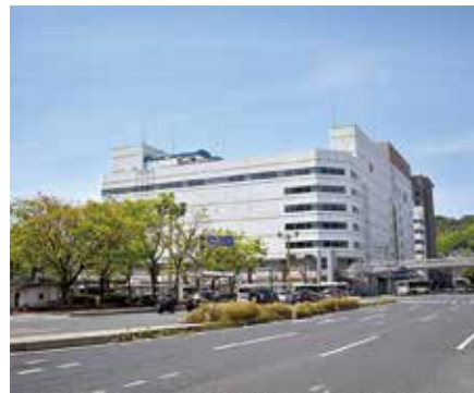
そごう呉店跡地の開発を

問 どのような施策を実施するのか 呉駅周辺地域総合開発をどのように呉市全体のまちづくりを生かしていきますか。また、そのためにどのような施策を進めていきますか。 答 呉駅交通ターミナルの整備と、そごう呉店跡地における民間開発の誘致とを一体的に進めることで、相乗効果を生み出し、駅周辺のにぎわいを再生し、さらに発展させていきます。また、呉駅周辺地域総合開発は、スマートモビリティの乗り入れを視野に入れており、自動運転車両から得られる膨大なデータを