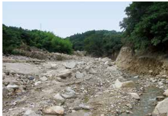
戸浜川の被災箇所

A 戸浜川の被災延長が、1キロ以上に渡り甚大な被害を受けており、現地の調査、国や県との復旧手法の検討及び工事の設計に時間を要し、また、関係地権者も多く、コロナ禍で行動制限もあり、この時期となりました。