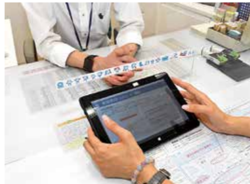
タブレットで分かりやすく

A コロナ禍における職員の分散勤務や、災害発生時にボランティアの方々にインターネット環境を提供できます。また、今年度、市窓口にタブレットの導入も計画しており、市民に、タブレットで地図などを見せながら説明することも可能になります。窓口での申請に、タブレットを用いることにより、申請書を「書かない市役所」とすることも検討していきます、今回の無線環境整備は、将来的な行政サービスの拡充につながると考えています。