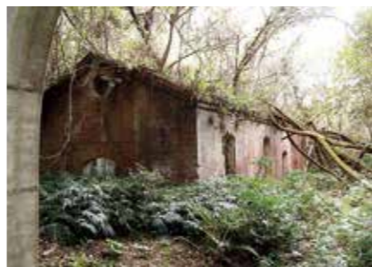
日本遺産の亀ヶ首発射場跡

県内関係市町や広島県観光連盟をはじめとする関係団体などと情報発信などで連携を図りながら、今後も誘客促進につなげたいと考えています。また、朝鮮通信使縁地連絡協議会やユネスコ連絡部会などの事業を通じて連携を図り、国際交流を深めていきたいと考えています。