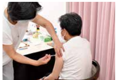
新型コロナワクチン接種