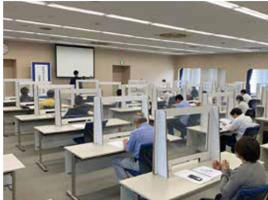
事業説明会には多くの事業者が参加