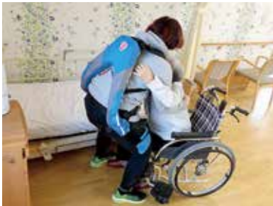
アシストスーツで介護負担を軽減

介護ロボットやICTなどは、人手不足への対応と職員の負担軽減につながるため、導入の促進を図っているところであります。また、個人の健康データの利活用については、国のデータヘルス改革に沿って、今後はオーダーメイドの健康づくり、重症化予防、介護予防などが可能となり、健康寿命の延伸につながるのと考