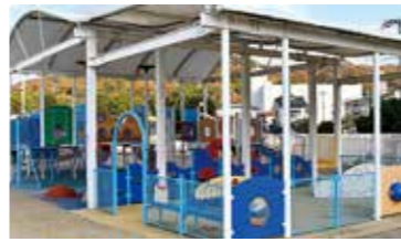
成長に合わせた遊具の設置を

市の公園は3歳以上を対象とした遊具しかないため、現在、設計中の中央公園の再整備事業では、1歳から3歳を対象としたキッズスペースを計画しています。また、今後は扉の設置を含めた安全対策を検討しますが、地域の公園は徒歩での利用を前提に配置しているため、駐車場の設置は考えていません。