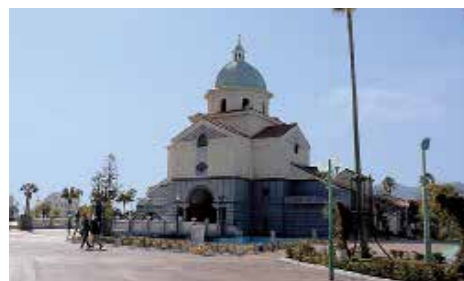
呉ポートピアパーク