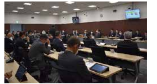
さまざまな角度から質問し確認する

市からは、発生状況とPCR検査結果などの報告、そして影響を受けた人に対する支援策や今後の相談・検査・治療の流れについての説明がありました。議会からは、情報公開の考え方やプレミアム付商品券などについて質問し、市民生活を守るために適切に取り組まれているのかを確認しました。