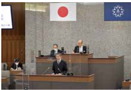
本会議で議案説明する新原市長

A 市長選挙への影響を極力避けるため、選挙から1年程度離れたこの定例会までに意思決定しなければなりません。そのため、今後新型コロナウイルス感染症が収束した場合でも、今回の決定方針は変更しない考えです。