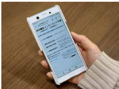
▲スマホで手軽に本会議などを視聴