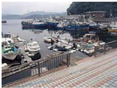
無秩序に係留されるプレジャーボート

A 新たに船溜まりを作るのではなく、既存のストックを十分に活用して許可区域を設定します。その際は、地元の漁協などの関係者から意見を聞きながらルールと秩序をつくり、放置艇を解消していきます。