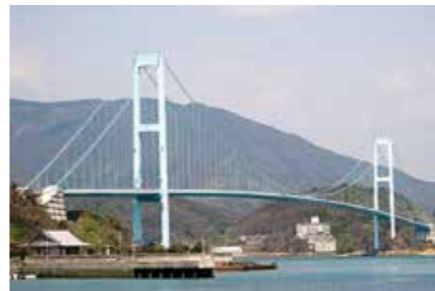
有料での運用が続く安芸灘大橋

広島県の有料道路である安芸灘大橋の通行料金の見直しを含めた地域振興については、県と協議を重ね、機会あることに要望してきました。しかしながら、県としては引き続き借入金に着実な償還と適切な維持管理に努めていく考えであり、早期無料化は困難な状況です。なお、今年度からは、子育て世帯への通行料金助成や未整備であった光回線の整備などの事業を行っており、今後も一層の地域振興に取り組みを考えています。