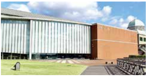
リニューアルを計画する大和ミュージアム

令和2年10月に呉市観光振興計画策定委員会を設置し、観光を市の基幹産業とするため、目標の設定と達成に向けた取り組みの方向性などを議論しているところです。今後、委員会での議論を踏まえ、内容や進捗状況などについて丁寧に説明していきます。