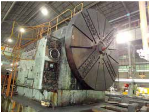
展示に向け検討中の大型旋盤

A 大型試験機については、今回の地盤調査と併せて展示先の検討も必要と考えています。現在、大和ミュージアムのリニューアルの計画が進行しており、その中でも回遊性について度々話が出てきているため、十分に議論をした上で、今後、計画をお示ししたいと考えています。