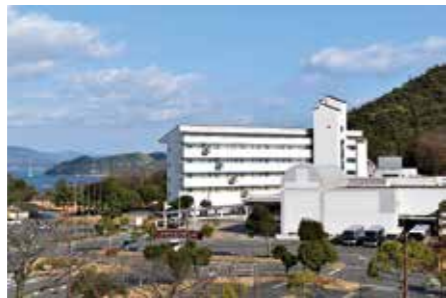
観光施設に適切な支援を

新型コロナウイルス感染症の拡大は、観光施設の運営に大きな影響を与えており、利用料金の減収などに対応するため、補正予算では、延べ55の指定管理者に対する合計1億4000万円余りの支援を提案しています。また、各施設には、新しい生活様式に合わせたガイドラインに沿った対応と、一層の誘客や観