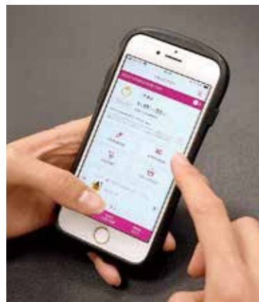
子育て支援アプリ「くれっこアプリ」

不育治療のみならず、不妊治療も含め総合的に考えていく必要があると考えており、不妊や不育に悩まれている方に寄り添っていくためにも、県内や他市の取り組みを参考にしながら検討したいと考えています。