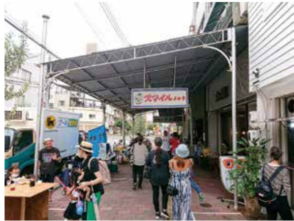
まちでワクワクとにぎわいを創出

市民の皆さんが当たり前の日常を無事何事もなく過ごすことができるようにすることが第一であり、その上で、明るく、楽しく、イキイキワクワクと過ごしていただくことも大切だと考えています。それには、女性や若者が自分の夢に向かってチャレンジできるまちを目指すことが、くれワンダーランド構想です。具体的には、子育て世代に住みやすいまちづくり、中小企業・経済を取り戻し、未来につながる事業の創造につなげること、医療・介護サービスの充実・発展、公平で隠しごとのないクリーンな行政、市長退職金市民評価制度の導入の5つの宣言です。今後は、今まで以上にできるだけ市内隅々まで回り、市役所の施策を説明するとともに、多くの市民の皆さんからそれぞれの地域の課題を含めて話を聴くことができる機会を設けていきたいと考えています。