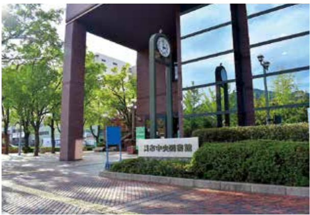
訪れなくても借りられるように

A 電子図書館サービスは、既存の利用者カードを活用してサービスを提供するため、現在、利用者カードを取得されている人は、利用者カード作成時に設定した暗証番号を活用して、そのまま利用することができます。