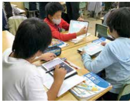
タブレット導入で学びを充実

A GIGAスクール構想の加速化によって、生徒がタブレットを持ち帰ることが前提となったため、予定していた充電式保管庫728台を購入する必要がなくなりました。また、国から標準仕様書が示されたため、実施数量や金額を精査した結果、減額となりました。