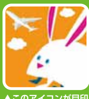
▲このアイコンが目印