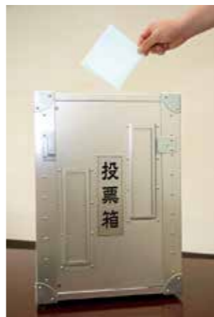
この1票にたどり着く施策を

熊谷市の取り組みは、主に将来の有権者である小中学生に対する啓発活動です。呉市も、このような啓発は重要と認識しており、市職員や呉市明るい選挙推進協議会の役員が、学校で出前講座や模擬投票を実施しています。また、新しく有権者になった方には、選挙制度の啓発資料を郵送するなど、今後も啓発活動に努めて投票率向上を目指します。