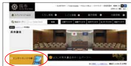
呉市議会ホームページのホーム画面

※スマートフォン及びタブレットで録画映像を視聴する場合は、平成28年4月以降の会議が対象です。 ※視聴には再生できる環境（Windows Media Player など）が必要です。 ※音声が出ますので、視聴の際には音量設定にご注意ください。