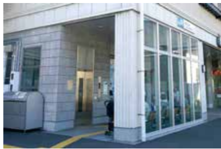
エレベーター設置済みの新広駅

高齢者や障害のある人を含め、あらゆる人の移動の利便性や安全性向上のため、早期の駅のバリアフリー化の推進が必要であると認識しています。これまでも度々JR西日本に要望しており、引き続き早期のバリアフリー化推進について、粘り強く協議してまいります。