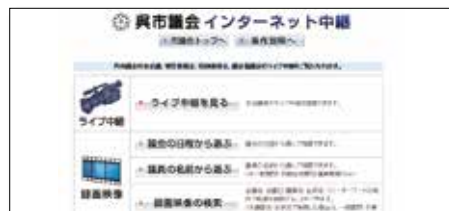
視聴する会議の選択画面