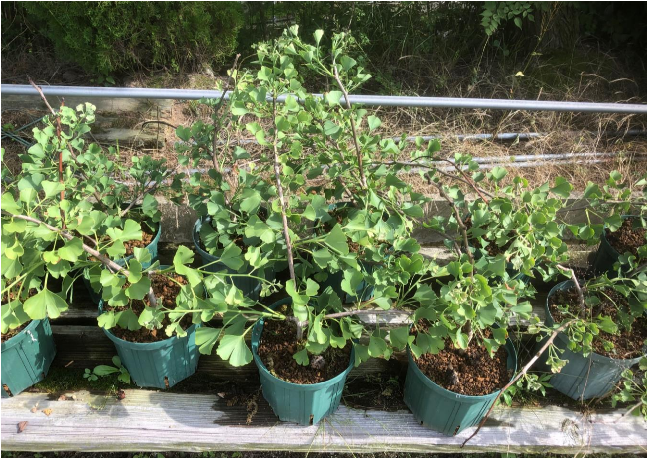
東郷元帥ゆかりの銀杏の木（令和2年6月18日撮影）