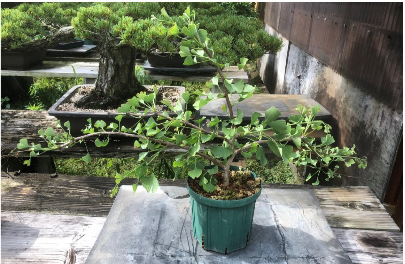
東郷元帥ゆかりの銀杏の木（令和2年6月18日撮影）