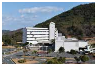
グリーンピアせとうち