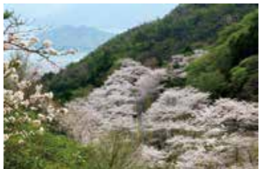
すばらしい観光資源

問 野呂山は魅力があるにもかかわらず、長年活用策が見えていません。市ではリノベーションを進めており、野呂山全体がリノベーションの格好の場と思えますが、市の考えを伺います。