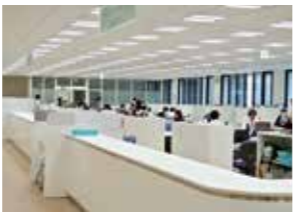
求められる働き方改革

現在、介護休暇や自己啓発等休業の制度を整備しています。今後、業務の効率化、時間外勤務の適正管理、年次有給休暇の取得促進、再任用職員や非常勤職員の活用、事業の見直しや重点化等にも努めていく必要があると考えています。