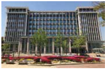
真に必要な施策を厳選

厳しい財政事情の中で予算を編成しなければなりません。現在、総力を挙げて災害からの復興に向けて取り組み、被災者が被災前の生活を取り戻せるよう災害からの復旧・復興に重点配分を行うとともに、行財政改革のさらなる推進を図り