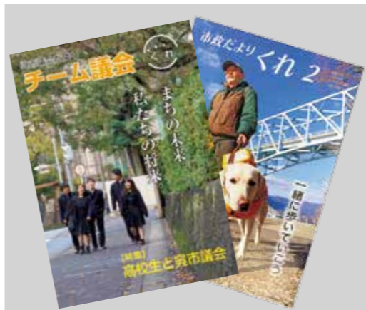
ユニバーサルデザインフォントを使用した広報紙

例えば、平成30年の豪雨災害では、避難情報や支援情報を子どもや高齢者、外国人住民にもわかりやすい簡単な日本語で発