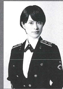
三宅 由佳莉 Yukari Miyake

1979年、「都会千夜一夜」でデビュー。2枚目のシングル「大阪で生まれた女」が大ヒット。自身の活動以外にも森進一や沢田研二や近藤真彦八代亜紀を始め、多くのアーティストへの楽曲提供も手掛ける。当コンサートにも過去6回出演し、そのブルージでハートフルな歌声で観客を魅了。お馴染みの軽快なトークで更に会場を盛り上げます。