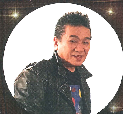
Special Guest BORO Singer Song Writer