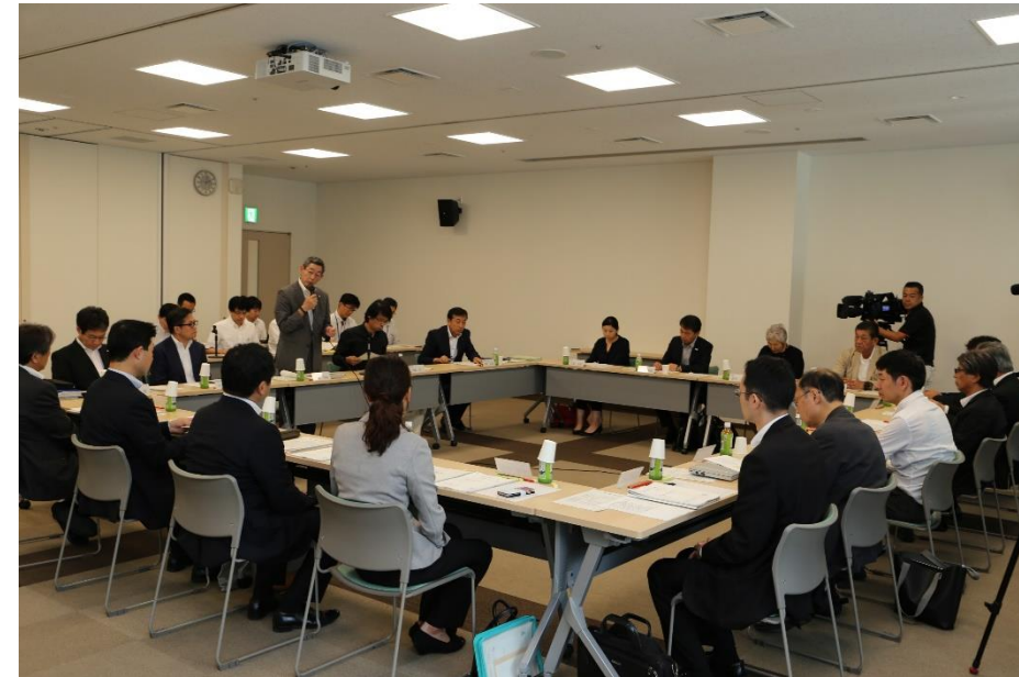
▲ 呉市復興計画検討委員会第5回会議の様子