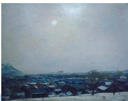
井上自助 《函館の午後》