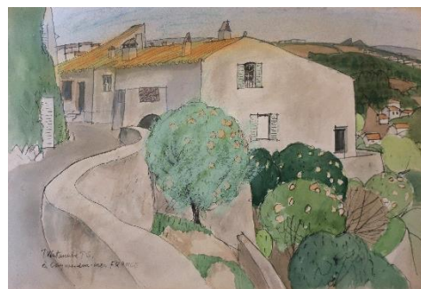
渡辺武夫 《カーニユ・シュール・メール》