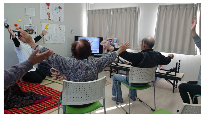
地域支え合いセンター 「みんなで体操」