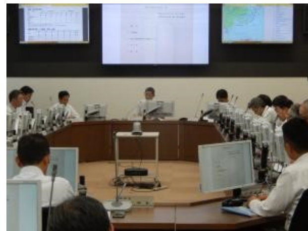
▲ 第1回災害復興本部会議