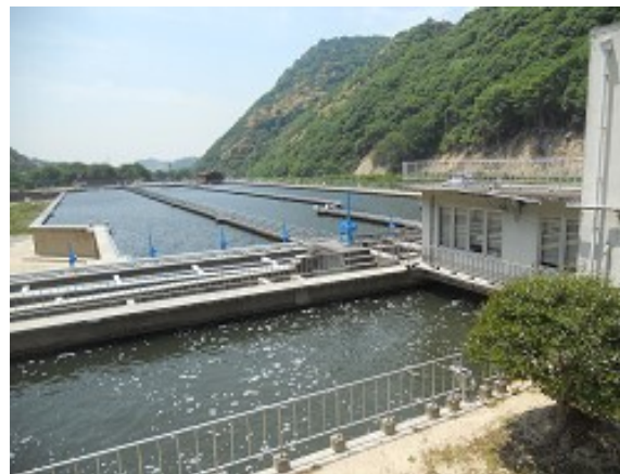
R元. 6. 1の二級水源地の状況 (工業用水道の給水を再開)