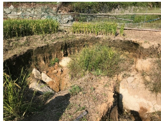
被災した安浦地区の農地