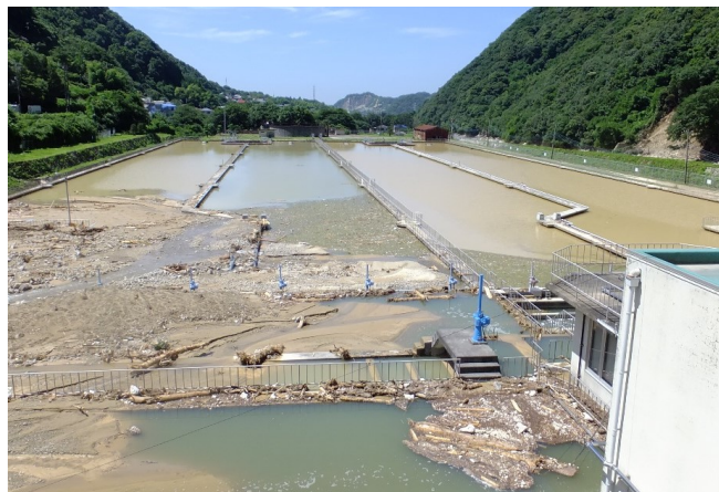
被災直後の二級水源地の状況