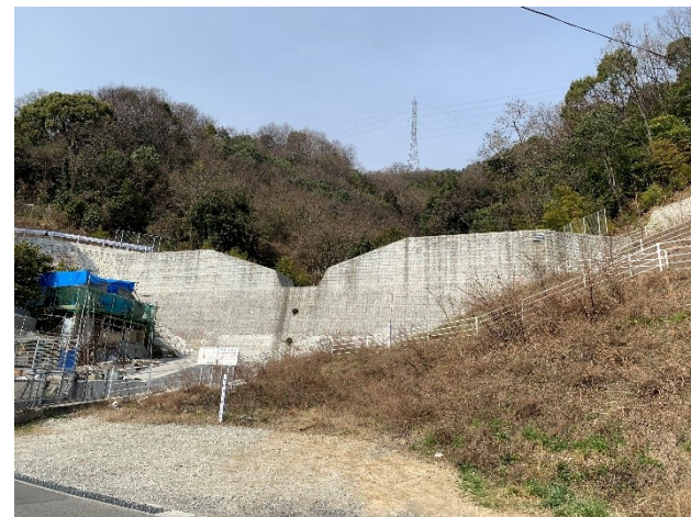
平成29年に完成した砂防ダム (広横路2丁目)