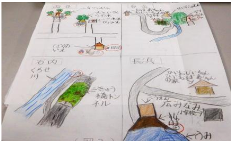
<けんきゅうしたばしょの地図>