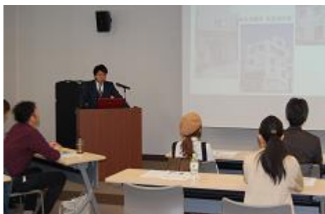
＜成果発表会の様子＞