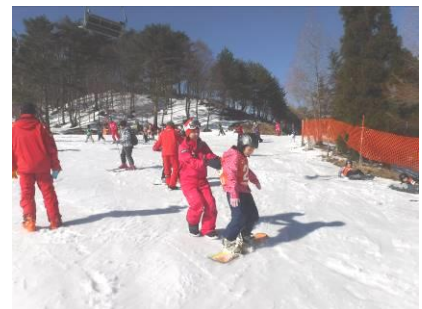
スノーボード体験教室