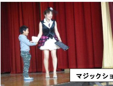
マジックショー（体育館にて）