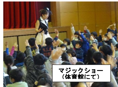
マジックショー （体育館にて）