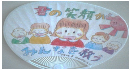
メッセージボード