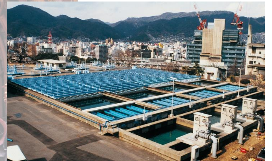
▲宮原浄水場内：改良した薬品沈殿池〈平成9年〉