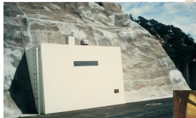
▲本庄隧道配水池西側坑口