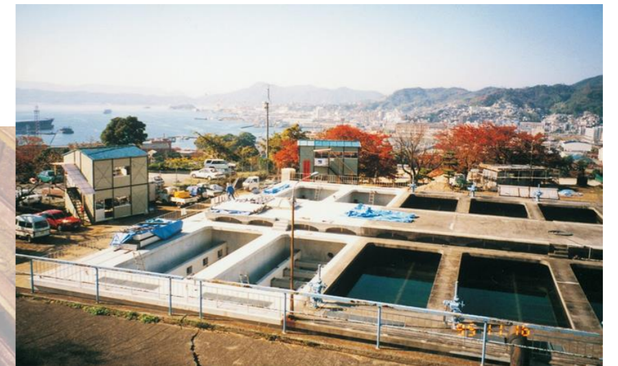
▲宮原浄水場内：拡張工事中の急速ろ過池〈平成7年〉

このため、水質が良好な太田川を水源とする宮原浄水場水系に切り替えることとし、平成5年度から、宮原浄水場薬品沈殿池の改良や急速ろ過池を4池増設するなど整備を進め、平成9年3月に水系の切り替えを行いました。