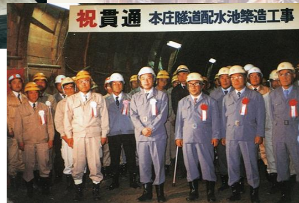
▲本庄隧道配水池貫通式〈昭和62年6月24日〉