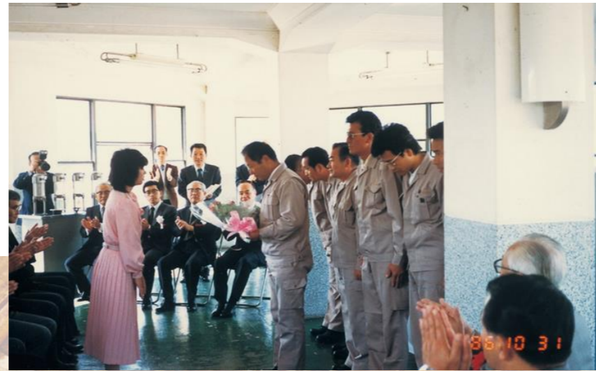
▲戸坂浄水場閉場式的一幕〈昭和61年〉

国道31号に大部分が埋設されている戸坂浄水場から呉市内への送水管は、老朽化に伴い漏水事故が多発している折柄、祇園新道バイパス建設に起因する県立盲学校（当時）移転用地としての要請があり、関係機関と協議を重ねた結果、戸坂浄水場を廃止することとしました。昭和61年10月31日に廃止し、戸坂取水場として再出発しました。