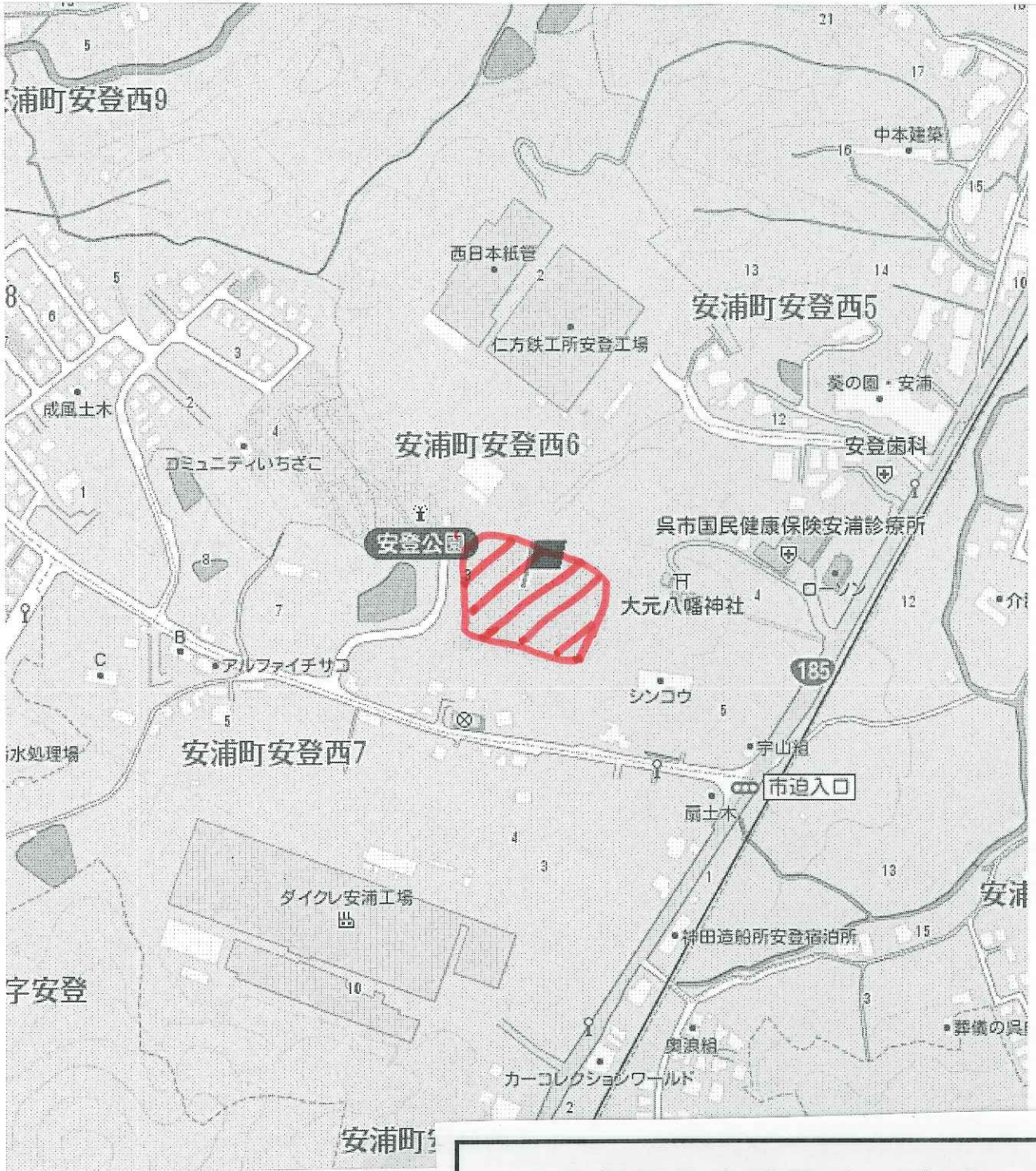
応急仮設住宅建設地（安浦）