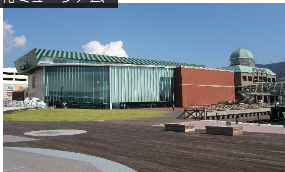
大和ミュージアム