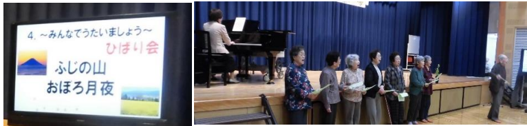
ひばり会による“みんなであたきましょう”