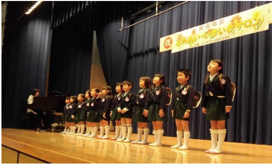
天応めぐみ幼稚園 園児（年長組）による合唱