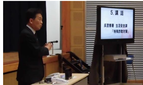
呉警察署生活安全課による特殊詐欺対策のお話