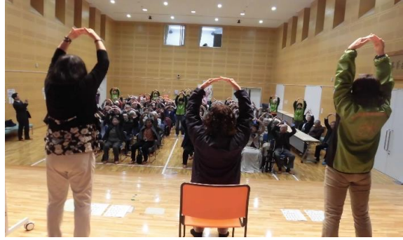
コスモス園・民生委員による“歩一歩たいそう”