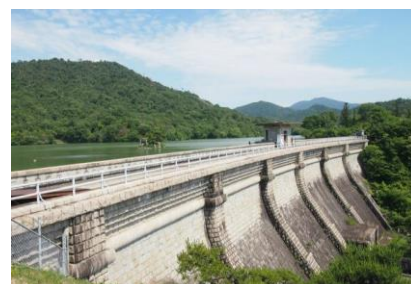
呉市本庄水源地堰堤水道施設 1920 年

軍港そして鎮守府が置かれたまちの歴史を共有し、その歴史を体感できるのは日本の中でこの 4 か所だけです。どこか懐かしくも逞しい往時の姿を残しつつ、日本の近代化に向けて躍動した軍港都市は、訪れる人々を惹きつけてやまないでしょう。