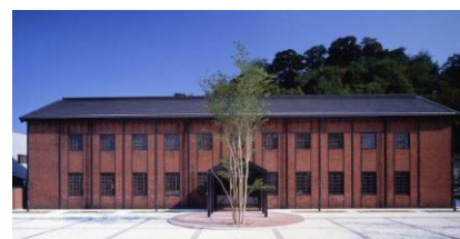
舞鶴市立赤れんが博物館 (旧舞鶴海軍兵器廠魚形水雷庫) 1903 年