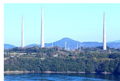
針尾送信所 (旧佐世保無線電信所施設)1922年