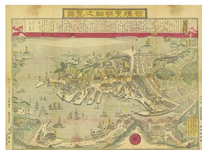
横須賀明細式覧図 (鎮守府開庁後の明治 18 年版、個人蔵)