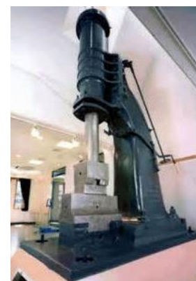
スチームハンマー0.5t片持型 横須賀製鉄所設置1865年オランダ製

また、今でこそ鉄筋コンクリート造は一般的な建築工法ですが、明治後期にはれんが造に代わる最新の技術として迎えられました。建築物としては佐世保海軍工廠貯所・汽罐室が始まりですが、明治41年に完成した横須賀の走水水源地浄水池が、現存最古級の建築としてその初期の技術を伝えます。さらに、大正11年に完成した佐世保の針尾送信所(高さ136mの塔3基)は、他に類を見ない日本最大の通信塔として、その技術の到達点と言えます。