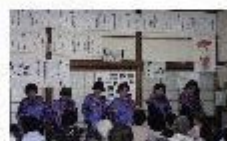
ハンドベルの演奏

住民に最も身近な組織であり、地域に根ざした活動を行う各種団体による研修会や各種事業の充実・活性化を図ります。