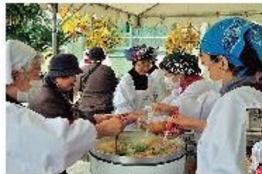
防犯パトロール 炊き出し