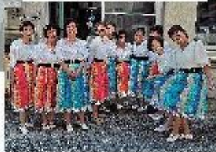
敬老会アトラクション