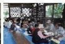
夏祭りでのオセロ