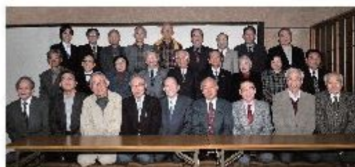
第四地区まちづくり委員会 (H22.3.15)